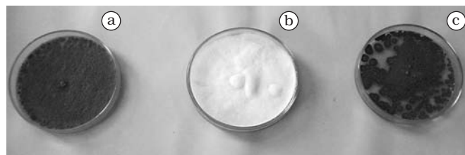
Figura 1. Visualização macroscópica: placas de cultura axênicas dos fungos a) Aspergillus flavus ; b) Fusarium solani ; e c) Penicillium sp.

Nas amostras analisadas verificou-se o desenvolvimento de vários fungos, entre os quais Mucor circinelloides , Rhizopus sp., Alternaria sp. e Micelia sterilia . O desenvolvimento dos fungos Aspergillus , Fusarium e Penicillium e suas características macroscópicas e microscópicas podem ser observadas nas Figuras 1 e 2.