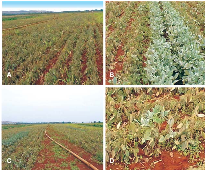
Figura 2. A) Vista geral do campo experimental nº 1; B) Detalhe de linhas com plantas transgênicas (direita) e não-transgênicas (esquerda) após a aplicação do herbicida; C) Vista geral do campo nº 2; D) Detalhe de uma planta transgênica ( F_1 ) resistente a herbicida, resultante do cruzamento de uma planta transgênica com uma não-transgênica.

A porcentagem de polinização cruzada foi calculada determinando-se o número de eventos tolerantes ao herbicida em relação ao número total de plantas em cada linha. Os eventos de polinização em cada linha foram analisados pela tolerância ao herbicida e presença do gene ahas (Figura 2). O número de eventos de polinização cruzada nas bordas noroeste, sudeste, nordeste e sudoeste em linhas não-transgênicas foram 27, 61, 49 e 47, respectivamente. A diferença no número de eventos nas bordas noroeste e sudeste pode ser explicada pela densidade e proximidade das linhas da parcela central com transgênicos. A borda noroeste é próxima das linhas contendo plantas transgênicas e não-transgênicas na parcela central, orientadas na direção